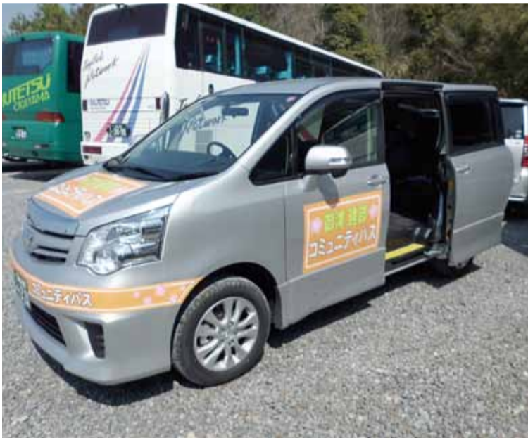
八幡温泉郷再整備スケジュール (案)

今後は、利用者の方々から出された改善要望等を基に、本年3月のJRダイヤ改正にあわせ、さらに便利で使いやすくなるため、時刻の改正等を行なう予定です。更なる利便性の向上に向けて来年度は、色々なご意見をお聞きする機会を持たなければならぬと思っております。