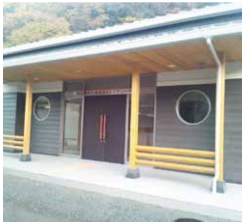
3月に落成式が予定されている金川地区コミュニティハウス

平成24年6月定例岡山市議会は6月11日開会・6月28日まで18日間の会期で、又、8月24日に臨時岡山市議会が開催されました。 平成24年9月定例岡山市議会は、9月4日開会・9月27日まで24日間の会期で開催されました。 平成24年11月定例市議会は11月29日開会・12月17日まで19日間の会期で開催されました。