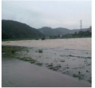
増水した旭川の幸福橋付近(平成22年7月14日)