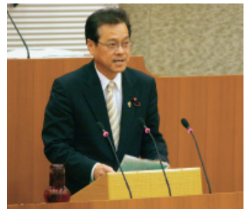
平成21年11月定例会市議会での個人質問

林政課が御津支所に設置された経緯と、21年度の機構改革で本庁の農林水産課水産林政係とした根拠は何か。又、御津・建部・足守等農山村地域、中山間地域を所管する北区内には、中山間地域対策室のようは、農林水産を含む地域振興まで含んだ特別プロジェクト部門が必要ではないか。