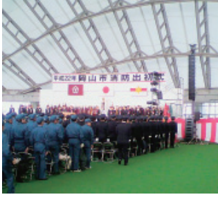
平成22年岡山市消防出初式